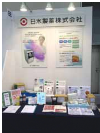
【 展示ブース全景 】